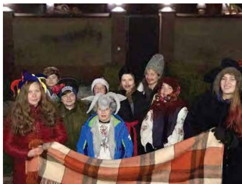
«Небо і Земля, Небо і Земля нині торжествують...»

Цією відомою колядкою юні горяни, більшість з яких є членами національної скаутської організації Пласт, вітали своїх односельців з Різдом Христовим. Діти за допомогою дорослих старанно готувались: вчили колядки, щедрівки та новорічну виставу-гру «Меланка». Щороку вони вчать нові вітальні пісні та вистави.